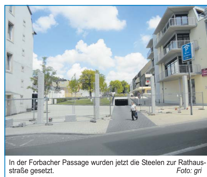
In der Forbacher Passage wurden jetzt die Steelen zur Rathausstraße gesetzt.

Wesentliche Veränderungen bei den derzeit laufenden Arbeiten waren die Wegnahme der vorhandenen Mauern bzw. Hochbeete und die bereits umgesetzte Entfernung eines Teils der zu eng stehenden Platanen. Zudem werden die Mauern zwischen den beiden höhenversetzten Ebenen durch Stufen analog zum südlichen Teil der Citypromenade ersetzt. Diese Arbeiten werden ab dem 25. Juli durchgeführt. Derzeit laufen noch Abdichtungsarbeiten an den Mauern und Deckenteilen der Tiefgarage. Die durchführende Firma wird