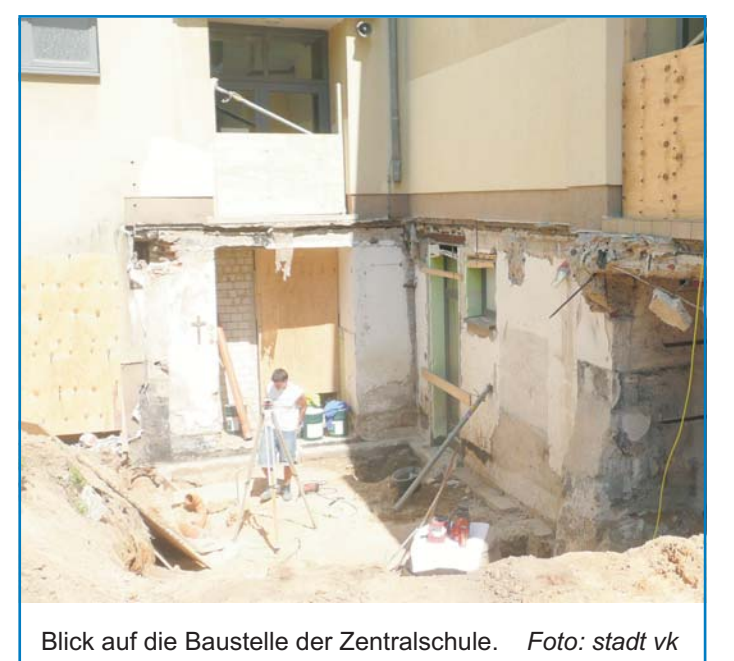
Blick auf die Baustelle der Zentralschule.

den durch zusätzliche Lehrerarbeitsplätze auch qualitative Verbesserungen im Schulbetrieb geschaffen. Die Kosten für die Sanierung und Herichtung der Räume betragen rund 150.000 Euro und werden im Rahmen des Konjunkturpaketes finanziert. „Optimal genutzte und auf modernstem Stand der Technik sanierte Räumlichkeiten sind das A und O, damit Schüler und Lehrer in entspannter Atmosphäre lernen und lehren können. Die barrierefreie Gestaltung und Sa-