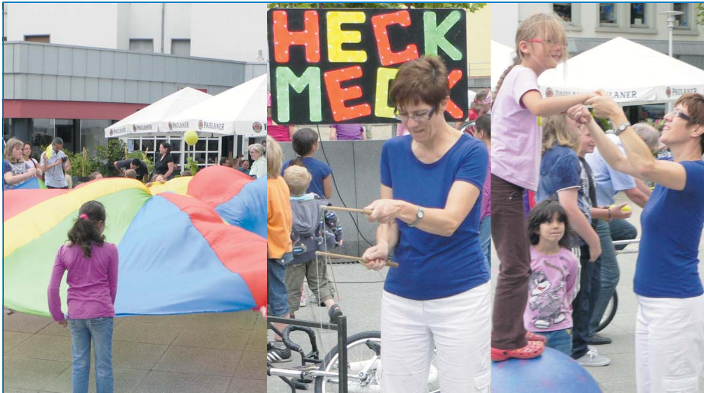
Bei der Aktion „Fit durch den Sommer“ nahm auch Ministerin Annegret Kramp-Karrenbauer mit großer Begeisterung teil. Die Aktion fand auf dem Adolph-Kolping-Platz in der Völklinger City statt.

Für unverlangt eingesandte Artikel übernimmt die Redaktion keine Haftung.