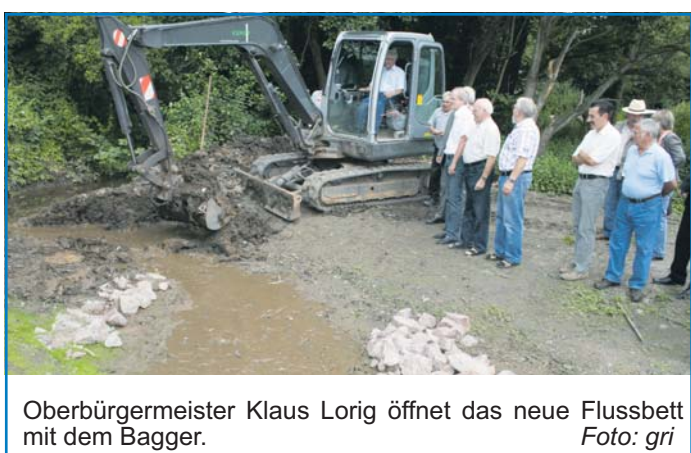
Oberbürgermeister Klaus Lorig öffnet das neue Flussbett mit dem Bagger.

das benachbarte, rund vier Hektar große Brachland „Herrgottswies“ durch biotopverbessernde Maßnahmen umgestaltet. Klaus Lorig, Oberbürgermeister der Stadt Völklingen, nahm mit einem Bagger den Dammdurchbruch vor und öffnete das neue Bachbett. „Die Renaturierung wertet den Bach ökologisch auf und bietet Tieren und Pflanzen eine neue Heimat. Der Eberbach war zudem bisher für die Spaziergänger in Geislautern verschwunden. Er ist heute wieder in das Bewusstsein der Bevölkerung zurückgekehrt und schafft den Menschen der Region wie unseren Gästen ein wertvolles Stück Wohnqualität“, so Lorig.